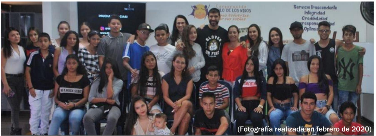
(Fotografía realizada en febrero de 2020)